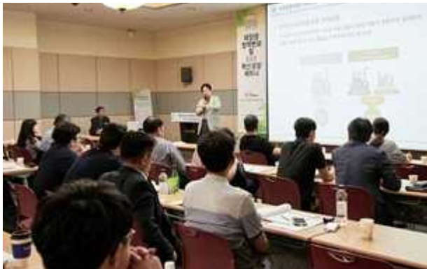
동시개최 컨퍼런스 전경