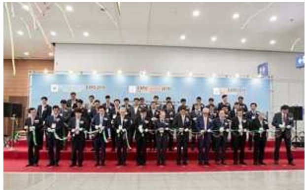
개막식 - 테이프 커팅식