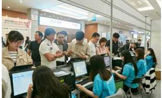
등록 접수대 전경