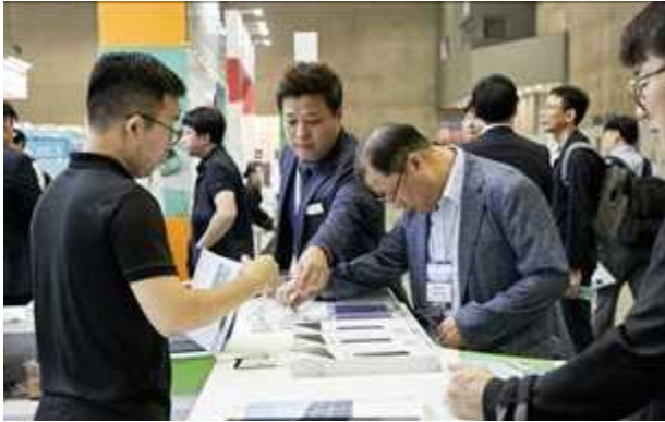
전시장 내부 전경 3