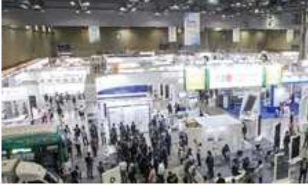
전시장 내부 전경 1